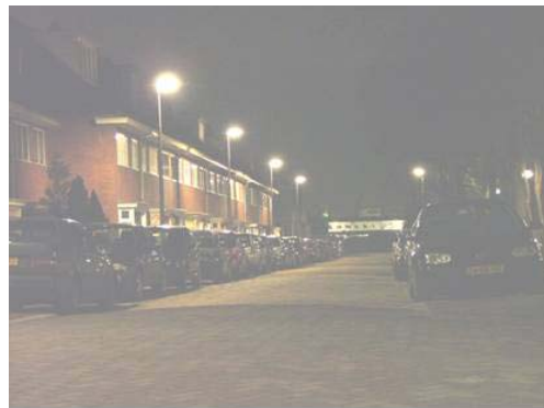
Figuur 2: openbare verlichting voor en na renovatie

In termen van de praktijkrichtlijn is de verlichtingsklasse opgewaardeerd van klasse S6/S5 naar klasse S5/S4. De overeenkomende waarden van de horizontale verlichtingssterkte zijn respectievelijk 2 à 3 lux en 4 à 5 lux. De gelijkmatigheid U_h bleef 0,2 à 0,3. Het is gebleken dat de armaturen in de nieuwe installaties over het algemeen iets minder diepstralend zijn dan die uit de oude installaties.