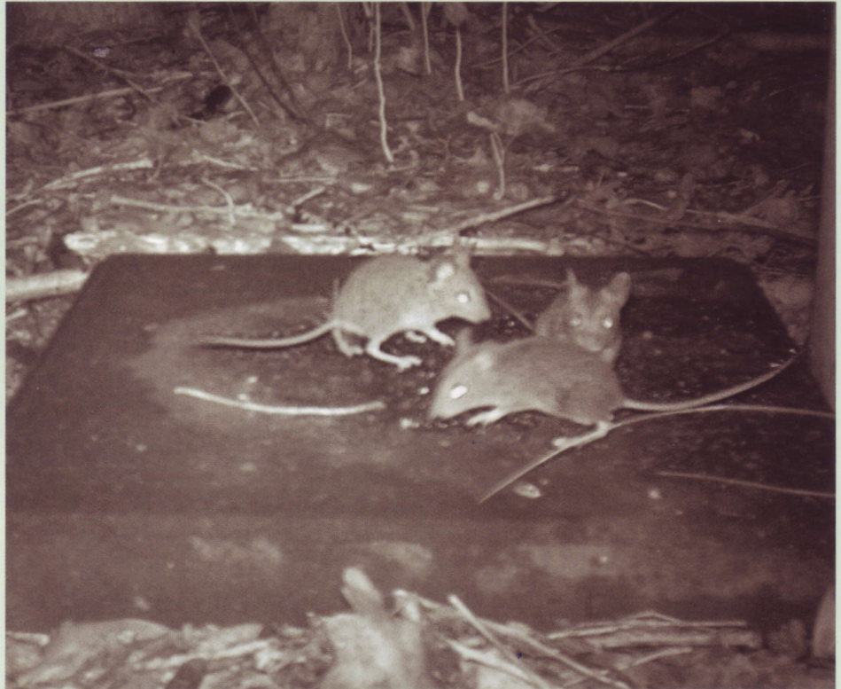
Foto 1. Een bijzondere foto uit het experiment; slechts een enkele keer lieten meerdere muizen zich tegelijk zien.