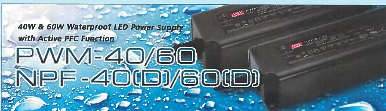
Figuur 3. De NPF-40(D)/60(D) en PWM-40/60 series van Mean Well voldoen aan de normen voor CE-markering.