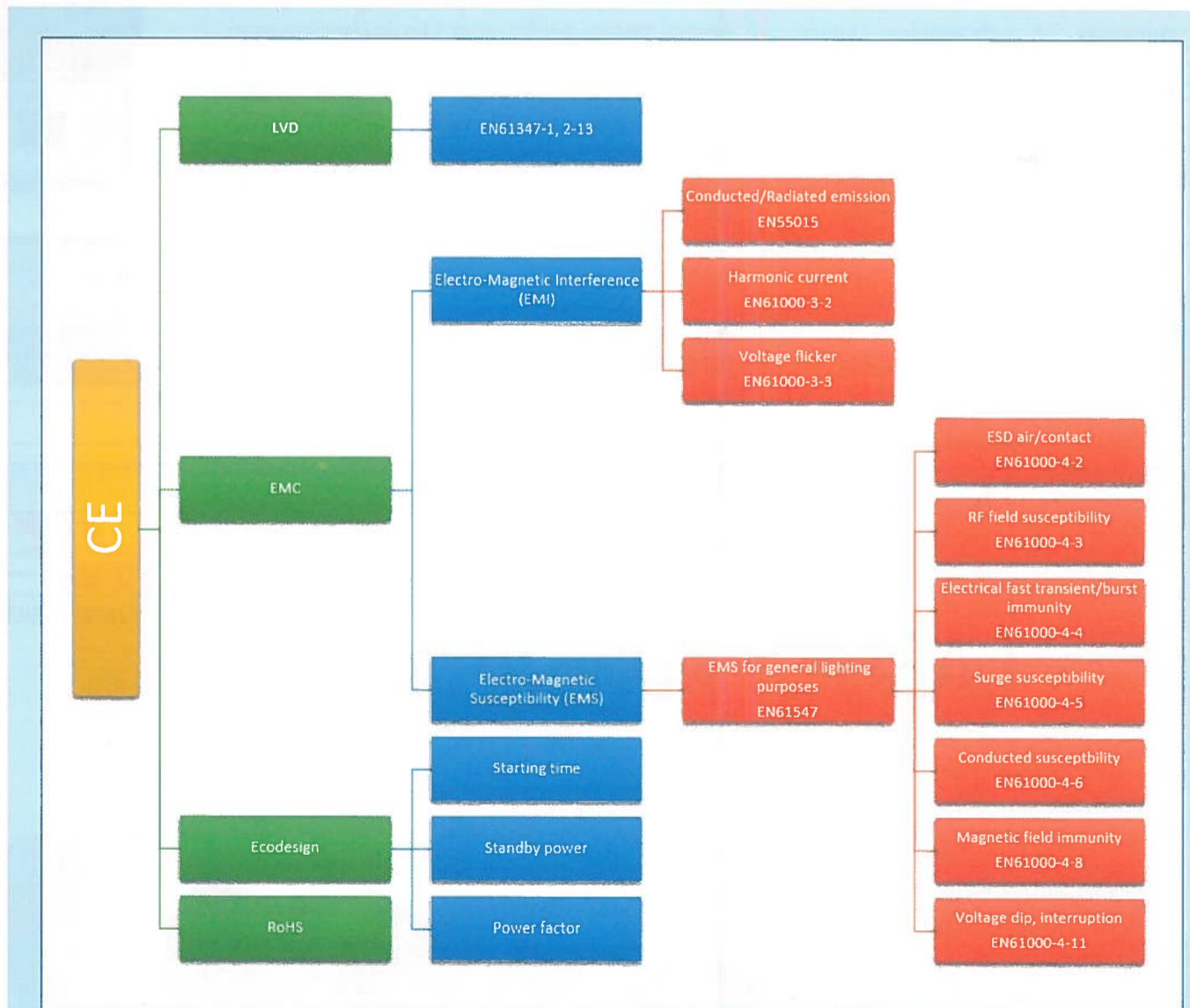
Figuur 1. CE eisen voor LED-driver of aansturing.

Hierin is THDi de totale harmonische distortie is; I_1 de fundamentele stroom; I_2 de 2 e orde harmonische stroom... enz.