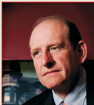
Con op den Kamp.